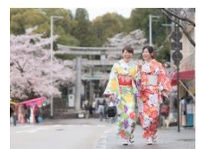
▲レンタル浴衣で 城下町散策

犬山は観光を基軸とした地方活性化事例ですが、全国で見れば、数多くの仕掛けが動いています。移住定住、地場産品、IT、まちづくり、ブランディング・・・これら地方活性化に寄与する広報力を、研究大会のテーマとして据えてはいかがでしょうか。本研究大会では、広報の持つチカラの活用方法を社会全体で共有することを目指します。統一論題シンポジウムにおいて、様々なテーマで地方を活性化させる仕掛け人を全国から招き、具体策から英知を導くアプローチを提案します。