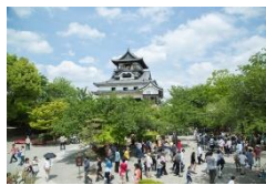
▲日本最古の木造建築・ 国宝犬山城

名古屋経済大学が位置する犬山市は、日本最古の木造建築の天守閣を有する国宝犬山城をはじめ、数多くの名所旧跡を有する観光都市です。実は10年ほど前まで、観光都市としての賑わいがさびれ、城下町は住居混在で生活道路と化し、店舗は閑古鳥が鳴く状況にありました。これを観光協会や商工会、自治体、私鉄、そして地元住民が共同して活性化策を練り、今では土日など犬山城が連日入城制限を行うほど、賑わいを取り戻しています。ここに至った取り組みには、地元経済界が立ち上げた城下町再生プロジェクト、観光協会や私鉄が仕掛けた広報作戦などがあり、最近ではメディア露出も激増しています。