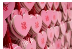
▲ハート絵馬が大ブレイク・ 三光稲荷神社