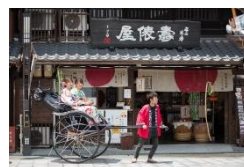
▲お笑い芸人が引く 人力車