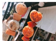
▲串グルメで食べ歩き